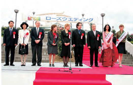
5/20 オープニングセレモニー 緑町公園