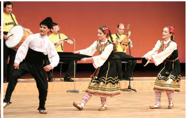
5/20 アルセナル民族舞踊団公演 リーデンローズ