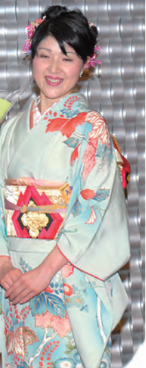
ーキャッスルホテル