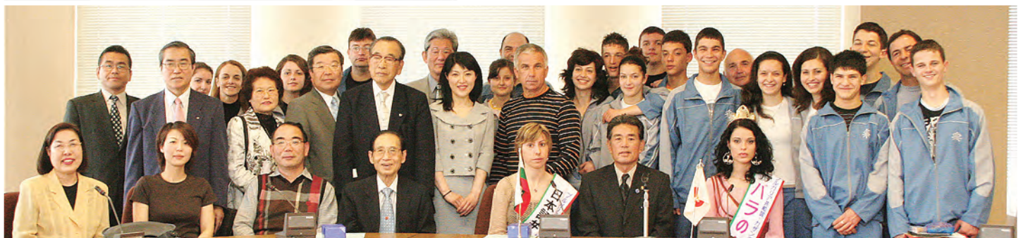
5/19 福山市長表敬訪問 福山市役所