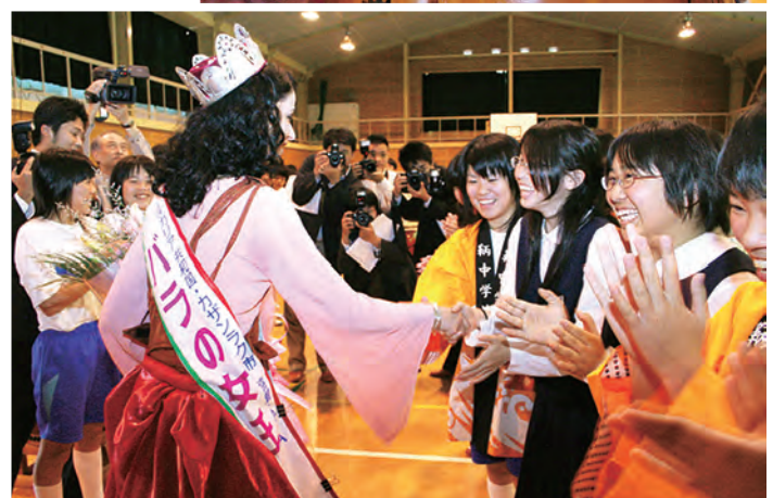
5/19 福山市立鞆中学校で親善交流